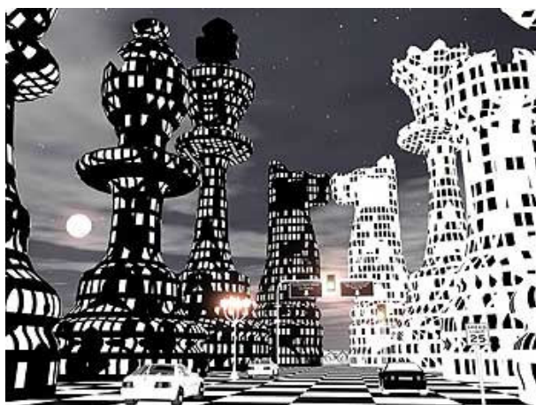
Figura 11: Chess City (projeto)

complexo de 32 prédios com o formato de peças de xadrez, onde serão realizados campeonatos, com hotéis para os participantes e centro de recepções. Custará U$ 2.6 bilhões 16 .