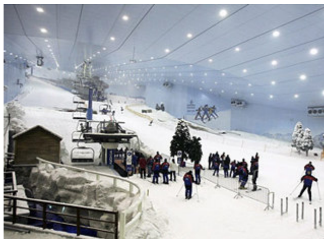
Figura 5: Ski Dubai (2005)

O preço de entrada é de U$ 35, com todos os equipamentos incluídos.