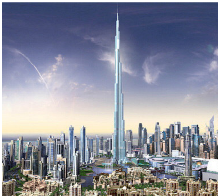
Figura 9: Burj Dubai (projeto)

Não só as mudanças no deserto e a criação de empreendimentos no oceano foram suficientes em Dubai. Com o intuito de ganhar destaque principalmente nos termos de grandes construções, a cidade aposta também na verticalização de algumas estruturas. A principal é o Burj Dubai que será o maior edifício do mundo com 160 andares, aproximadamente 705 metros de altura. Seu custo é de U$ 8 bilhões e contará com 30 mil residências, nove hotéis (um deles decorado pela grife Giorgio Armani), seis acres de parque dentre outras estruturas tais como os elevadores mais rápidos do mundo. A sua inauguração está prevista para 2008 15 .