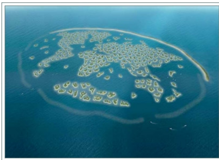
Figura 6: The World Islands (projeto)

Assim como o deserto não se mostrou como um obstáculo para a criação de empreendimentos, o próximo desafio foi de criá-los no oceano, expandindo assim, a possibilidade de investimentos em uma parte do território que não havia sido explorada. Esse será o caso do The World Islands , um complexo de 300 ilhas construídas artificialmente com o formato do mapa-mundi. Seu orçamento é de U$ 1,5 bilhão e tem previsão de finalização do projeto em 2008. As ilhas serão divididas em quatro categorias: casas privativas, casas em latifúndios, mega-resorts e ilhas comunitárias. Os únicos meios de transporte permitidos na região serão os aquáticos e os aéreos.