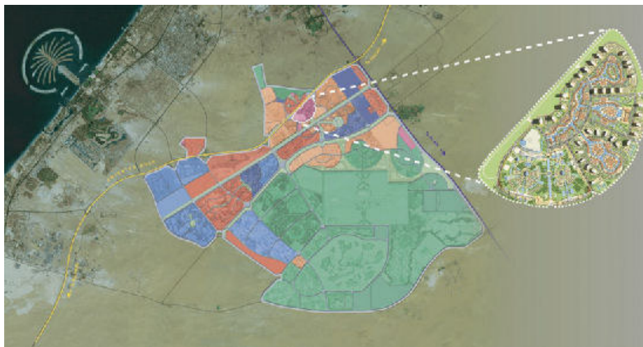
Figura 3: Dubailand (destaque para a Cidade das Arábias - projeto)