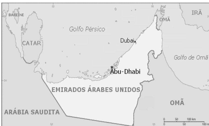
Figura 2: Localização de Dubai nos Emirados Árabes Unidos

Localiza-se a nordeste dos Emirados e tem saída para o Golfo Pérsico, uma região estratégica e de papel importante na economia do Oriente Médio.