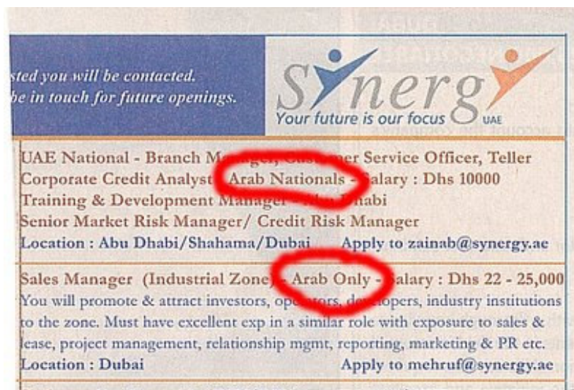
Figura 12: Jornal local com oferta de trabalho para árabes

Dentro do próprio mercado de trabalho criou-se em algumas empresas, um preconceito entre as nacionalidades. Devido à variedade de pessoas de culturas diferentes, os jornais locais anunciam vagas de emprego com exigência de nacionalidade: