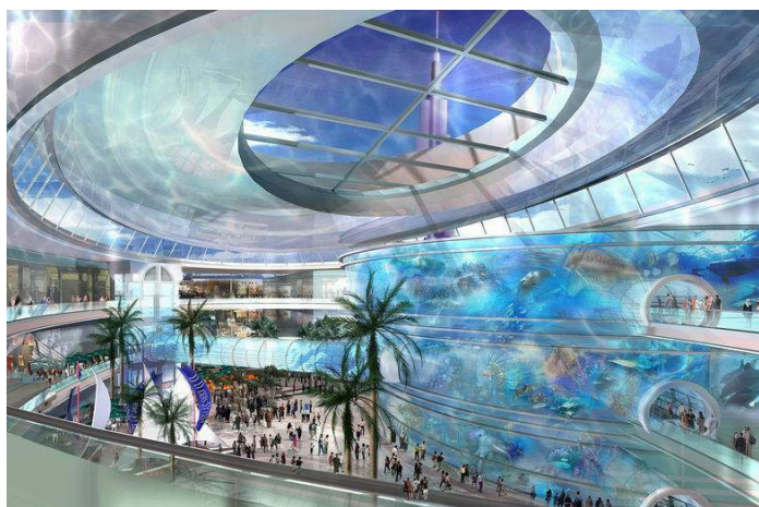
Figura 4: Dubai Mall (projeto)

Dando seqüência as grandes construções no deserto, um outro empreendimento que deve ser destacado é o Dubai Mall . Ele será considerado o maior shopping do mundo. Sua área é de 9 milhões de metros quadrados e além dos inúmeros serviços, contará com o maior aquário do mundo. A previsão de finalização é em 2008.