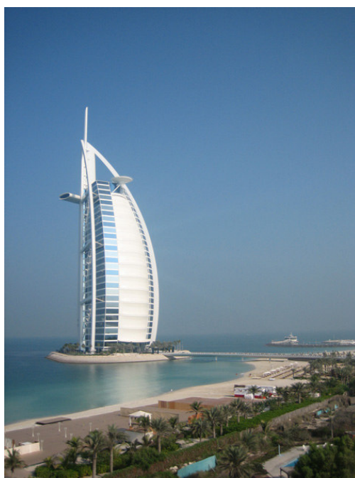
Figura 10: Burj al Arab (2004)

321 metros de altura e sua arquitetura é baseada no formato de um veleiro. Não possui quartos, apenas suítes duplex de luxo (202, no total) com atendimento personalizado para cada cliente, além de restaurantes luxuosos (um deles submerso) e um heliporto. As diárias variam entre U$ 1.600 mil e U$ 25.000 mil. Também ganhou destaque mundial por ter promovido uma “partida de tênis no céu”, em uma plataforma suspensa no alto do hotel.